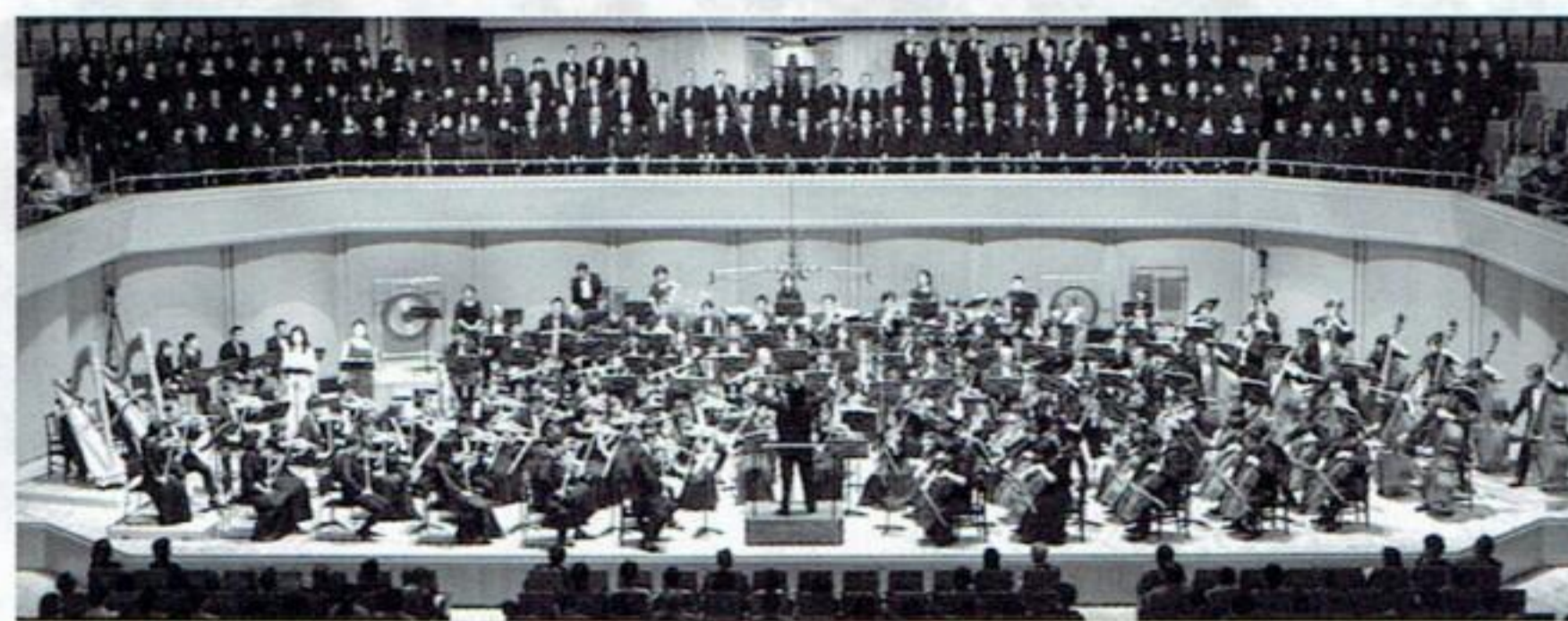
第70回記念定期演奏会

定期演奏会では、隠れた名曲や難曲、大編成の曲目にも積極的に挑戦する特色ある選曲を心がけ、練習では指揮者はじめ経験豊富なプロの先生方からの熱心な指導の下、楽しくかつ真摯に音楽に取り組んでいます。私たちが演奏を楽しむだけでなく、お客様にも一緒に楽しんでいただけるような演奏会を目指して活動しています。