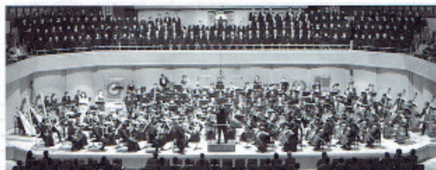
第70回記念定期演奏会

定期演奏会では、隠れた名曲や難曲、大編成の曲目にも積極的に挑戦する特色ある選曲を心がけ、練習では指揮者はじめ経験豊富なプロの先生方からの熱心な指導の下、楽しくかつ真摯に音楽に取り組んでいます。私たちが演奏を楽しむだけでなく、お客様にも一緒に楽しんでいただけるような演奏会を目指して活動しています。