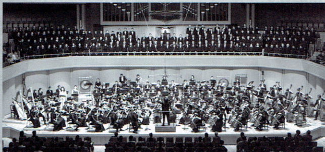
第70回記念定期演奏会

定期演奏会では、隠れた名曲や難曲にも積極的に挑戦する特色ある選曲を心がけ、練習では指揮者はじめ経験豊富なプロの先生方からの熱心な指導の下、楽しくかつ真摯に音楽に取り組んでいます。私たちが演奏を楽しむだけでなく、お客様にも一緒に楽しんでいただけるような演奏会を目指して活動しています。