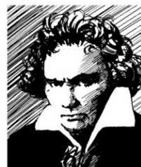
Ludwig van Beethoven 1770-1827 Germany