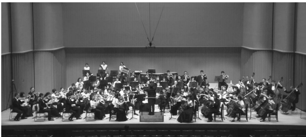
第17回定期演奏会 トヴォルジャーク：交響曲第7番 他 2018.7.22 東海市芸術劇場大ホール

18th Regular Concert June 9, 2019 1:45 pm Aichi Prefectural Art Theater The Concert Hall