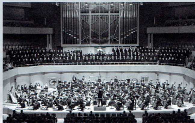
第70回記念定期演奏会

定期演奏会では、隠れた名曲や難曲、大編成の曲目にも積極的に挑戦する特色ある選曲を心がけ、練習では指揮者をはじめ経験豊富なプロの先生方からの熱心な指導の下、楽しくかつ真摯に音楽に取り組んでいます。私たちが演奏を楽しむだけでなく、お客様にも一緒に楽しんでいただけるような演奏会を目指して活動しています。